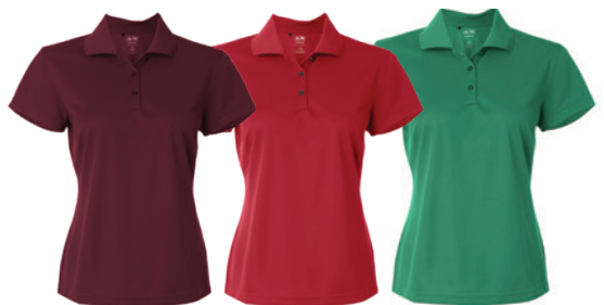
Collegiate Burgundy Bourgogne Collegiate Collegiate Red Rouge Collegiate Green Vert