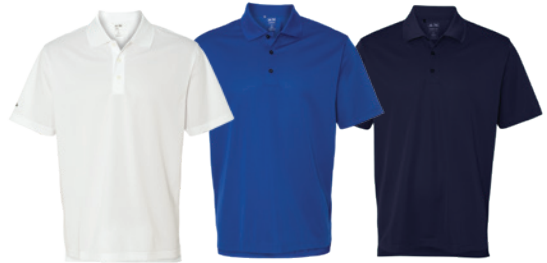
White Blanc Collegiate Royal Royal Collegiate Collegiate Navy Marine Collegiate