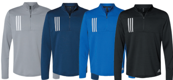
Grey Three/ White Gris Three/ Blanc Team Navy Blue/Grey Two Marine Team/ Gris Two Team Royal/ Grey Two Royal Team/ Gris Two Black/Grey Two Noir/Gris Two