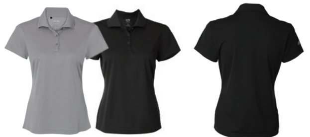
Grey Three Gris Three Black Noir Back Dos