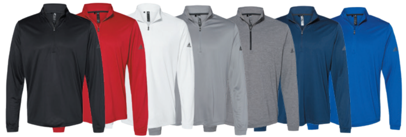
Black Noir Power Red Rouge Power White Blanc Grey Three Gris Three Black Heather Noir Cendré Collegiate Navy Marine Collegiate Collegiate Royal Royal Collegiate