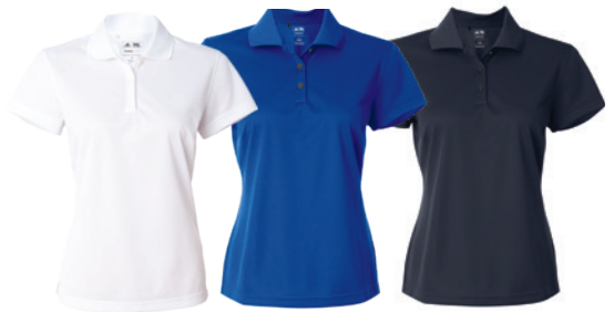
White Blanc Collegiate Royal Royal Collegiate Collegiate Navy Marine Collegiate