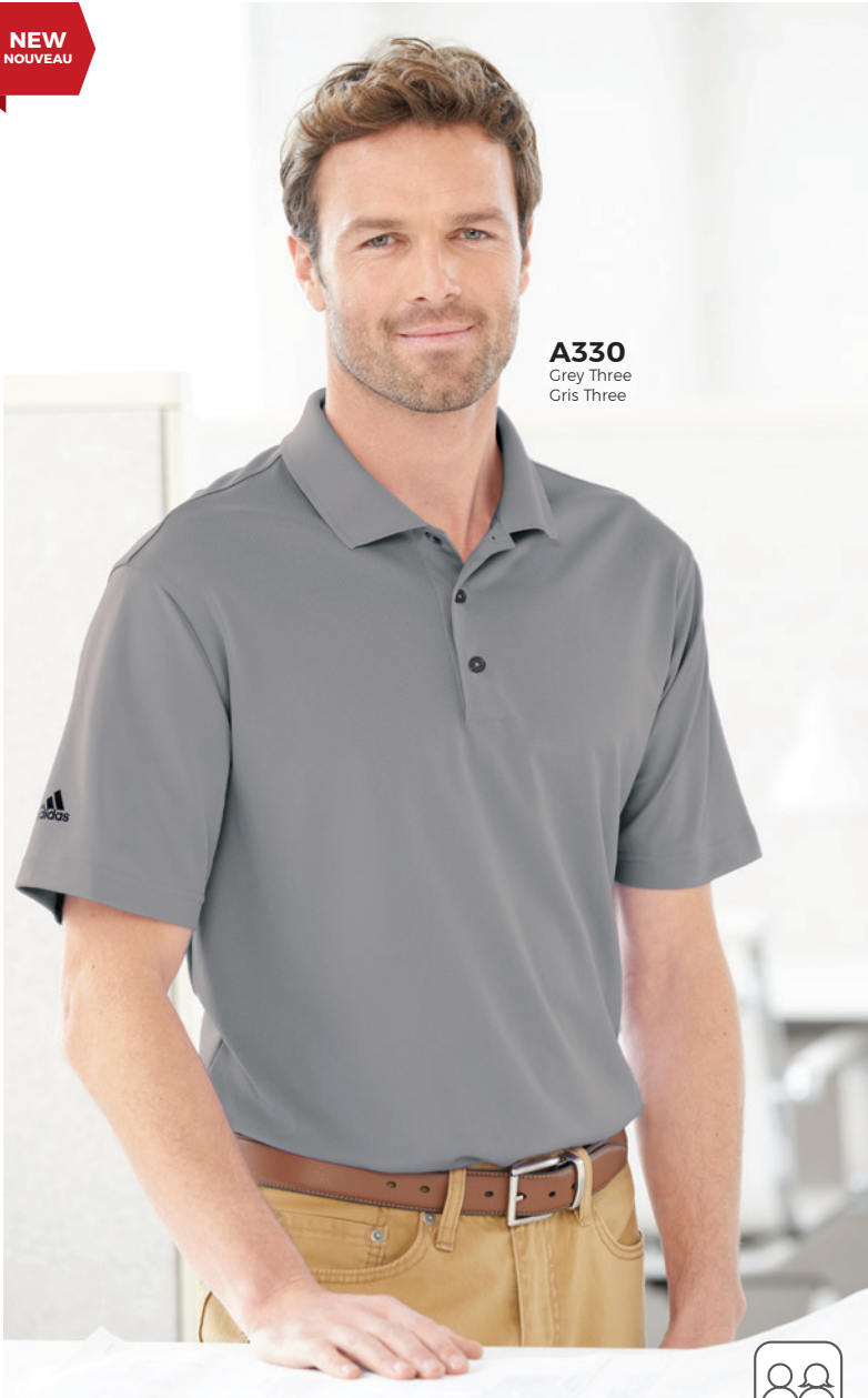
A330 Grey Three Gris Three