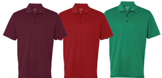
Collegiate Burgundy Bourgogne Collegiate Collegiate Red Rouge Collegiate Green Vert