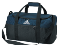
Collegiate Navy/Black Marine Collegiate/Noir