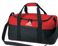
Collegiate Red/Black Rouge Collegiate/Noir