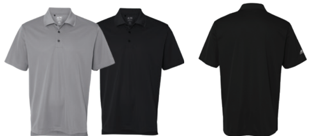
Grey Three Gris Three Black Noir Back Dos