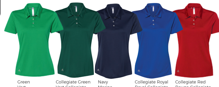
Green Vert Collegiate Green Vert Collegiate Navy Marine Collegiate Royal Royal Collegiate Collegiate Red Rouge Collegiate